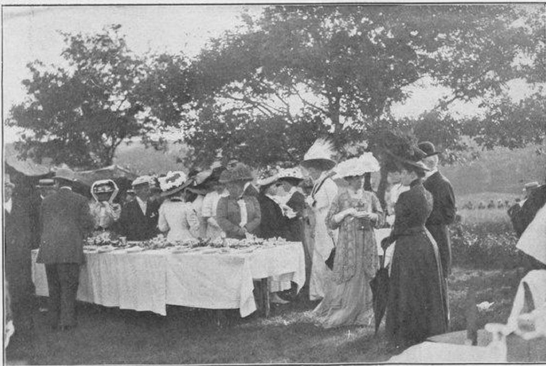
UN THÉ A L'ISSUE D'UNE RÉUNION DES DRAGS — S. A. R. LA PRINCESSE CLÉMENTINE (+)