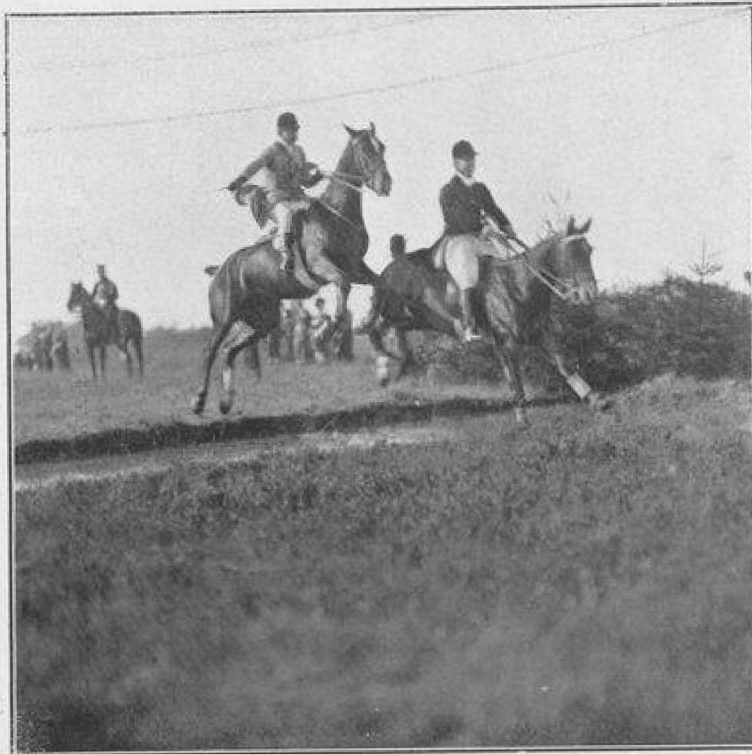
Cl. Massardo, Spa

« L'an prochain, les rendez-vous auront lieu trois fois par semaine en