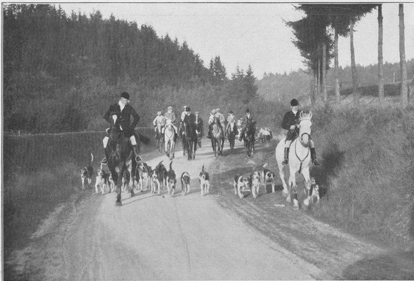
UNE RÉUNION DES DRAGS DE SPA — LE DÉPART