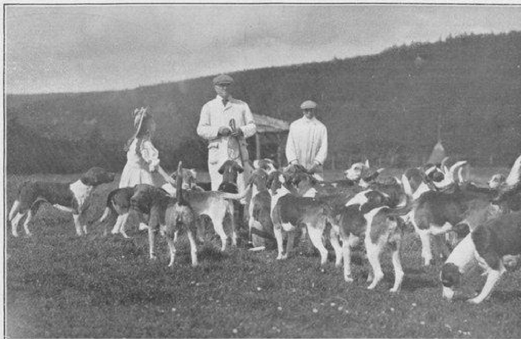
LA MEUTE DU SPA-DRAG-HUNT

Les meutes, au nombre de deux, composées de vingt à vingt-cinq chiens, fox-hounds et bâtards français, ont chassé à tour de rôle. Leur excellent état qui leur a valu l'admiration générale, est tout à l'honneur du kennelsman. Elles ont mené dur comme